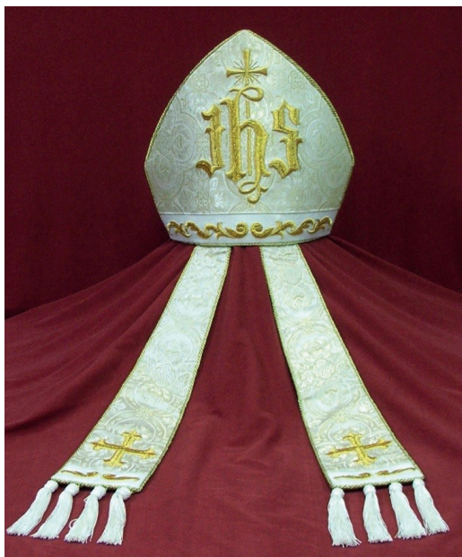
Fot. 2. Tylna tarcza mitry z fanonami

Obie tarcze interesującej nas mitry są identycznie wykonane i ozdobione. Na białym materiale, tkanym w kremowe motywy kwiatowe, ułożone w krzyże, wyhaftowany jest wypukłym haftem, gotyckimi literami, duży, złoty monogram IHS . W literę H wpisany jest krzyż, od góry wychodzący poza literę z promienistą glorią. Dolne części obydwu tarczy stanowi kremowy pasek materiału przetykany złotą nitką. Pasek dekorowany jest wypukłym, złotym haftem o motywie esowatych, grubych wici, ułożonych symetrycznie do środka i zakończonych małymi wolutkami. Krawędzie tarcz mitry okala złoty sznurerek. Jej wnętrze obszyte jest złotą podszewką (fot. 2).