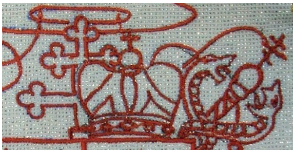
Fot. 7. Krzyż arcybiskupi oraz utensylia biskupa obrządku wschodniego: mitra i żezł