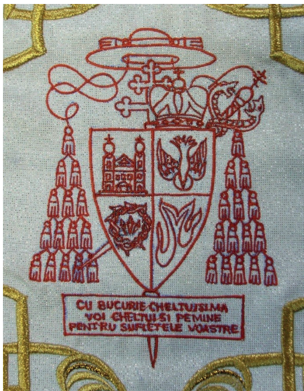
Fot. 5. Haftowany na kolumnach ornatu herb kardynalski

Łagiewniccy franciszkanie w zakrystii swojego kościoła przechowują ornat. Szatę tę synowie św. Franciszka potocznie nazywają ornatem Klemensowym lub o. Klemensa (chodzi tutaj o o. Klemensa Śliwińskiego). Na jego kolumnie znajduje się wyhaftowany herb biskupi (fot. 4). Ornat o wymiarach 155 cm x 116 cm, uszyty jest z białego materiału, takiego samego jak mitra: tkanego w kremowe wzory o motywach roślinnych, ułożonych w krzyże. Brzegi ornatu są obszyte złotym sznureczkiem.