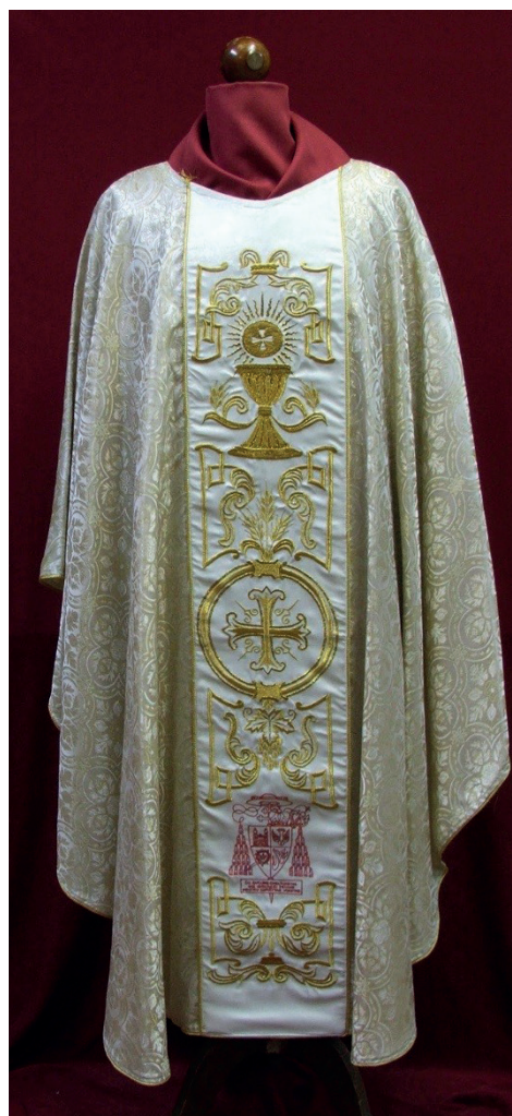
Fot. 4. Ornat pontyfikalny z widocznym herbem kardynalskim

Mitra, obok pastorału i tronu biskupiego, należy do oznak władzy pasterskiej i nauczycielskiej każdego biskupa.