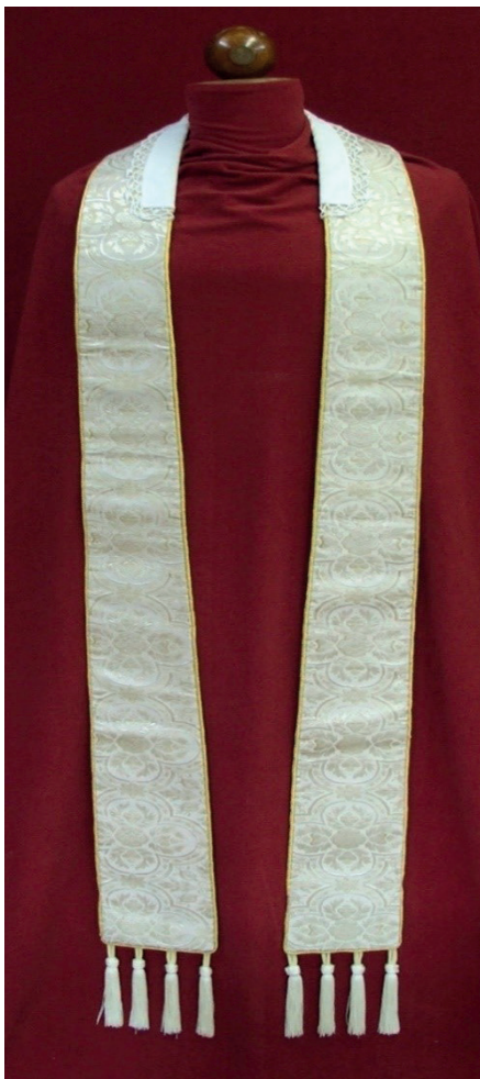
Fot. 9. Stuła z kompletu pontyfikalnego

szaty świętości, z jaką kapłan ma służyć innym 19 . Wskazuje na władzę i godność urzędu kapłańskiego 20 .