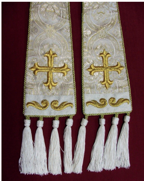
Fot. 3. Zakończenia fanonów mitry

Jest symbolem przyłbicy chroniącej walczącego z nieprzyjaciółmi wiary. Ma wskazywać świętości biskupa, ale przede wszystkim jest znakiem znajomości Staro- i Nowego Testamentu, łaski kapłańskiej i więzi z Bogiem. Biskup walczy i czuwa nad czystością wiary, której depozytu naucza zgodnie z Pismem Świętym. Tylne wstęgi, tzw. fanones , to symbole mistycznego i literalnego znaczenia Pisma Świętego, oznaczają także wyczucie i kulturę religijną, którymi winien odznaczać się biskup 8 .