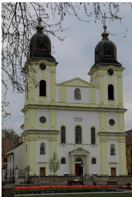
Fot. 6. Graficzne przedstawienie w herbie zarysu kościoła archikatedralnego w Blaj, w Rumunii, oraz zdjęcie świątyni